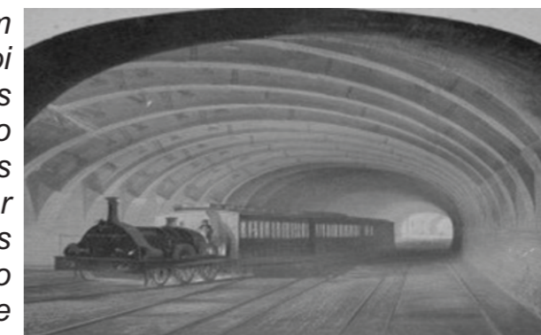
Primeiras composições começaram a circular pelos túneis em 1863

Teve discurso, banda de música e até um banquete subterrâneo para 700 pessoas. Foi com pompa e circunstância que Londres inaugurou, em 9 de janeiro de 1863, o primeiro metrô do mundo. Os convidados, quase todos homens de fraque e cartola, queriam conhecer os detalhes de cada estação para contar aos amigos até o dia seguinte, quando o serviço seria aberto aos plebeus. Para um povo que adora efemérides, os 150 anos do metrô de Londres serão um prato - ou um vagão-cheio.